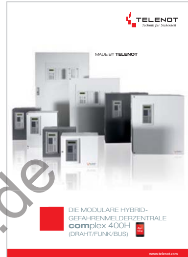
Prospekt „complex 400H“