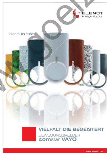
Prospekt „comstar VAYO“