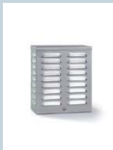
Akustische Kompakt-Signalgebereinheit ES 12 K

100059812 RAL 9016 verkehrsweiß, Zinkor-Stahlblech 100059831 RAL 9016 verkehrsweiß, Alu-Blech 100059836 Edelstahl Optik, Edelstahl V2A VdS-Klasse C (G 190001)