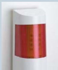
OAS-R weiß mit roter Linse VdS-Kl. C G 106056 Art.-Nr. 100059530