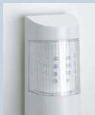
OAS-K weiß mit klarer Linse VdS-Kl. C G 106056 Art.-Nr. 100059531