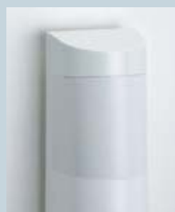
AS weiß VdS-Kl. C G 106055 Art.-Nr. 100059540

Nachrüstset für – Mastmontage 400059595 – Eckmontage 400059590