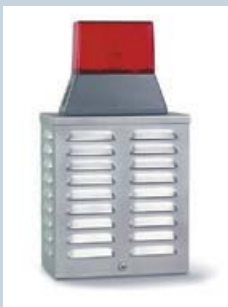
Akustisch-/Optische Kompakt-Signalgebereinheit ES 12 K/FBL 12

100059812 RAL 9016 verkehrsweiß, Zinkor-Stahlblech 100059831 RAL 9016 verkehrsweiß, Alu-Blech 100059836 Edelstahl Optik, Edelstahl V2A VdS-Klasse C (G 190001)