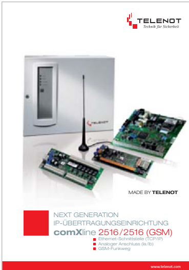
Prospekt „comXline 2516/2516 (GSM)“