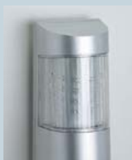
OAS-K silber mit klarer Linse VdS-Kl. C G 106056 Art.-Nr. 400059531

Nachrüstset für – Mastmontage 400059595 – Eckmontage 400059590