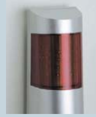
OAS-R silber mit roter Linse VdS-Kl. C G 106056 Art.-Nr. 400059530

Nachrüstset für – Mastmontage 400059595 – Eckmontage 400059590