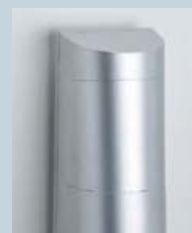
AS silber VdS-Kl. C G 106055 Art.-Nr. 400059540

Nachrüstset für – Mastmontage 400059595 – Eckmontage 400059590